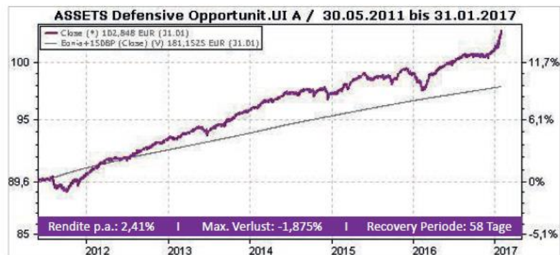
Renditeentwicklung (nach Gebühren vor Steuern) seit Auflage 31.05.2011 bis 31.01.2017; Quelle: vwd Vereinigte Wirtschaftsdienste GmbH;

Anlagestrategien für institutionelle Investoren und Investmentfonds gibt es viele – wichtig aber: sind diese auch erfolgreich? Der ASSETS Defensive Opportunities UI wurde am 30.05.2011 aufgelegt. Die max. Verlustperiode betrug seit Auflage 2 Monate, die Erholungsphase (Recovery Period) ebenfalls lediglich 58 Tage. Mit 53 positiven Monatsrendite aus 68 Monaten (per 31.01.2017) und einer Rendite von 14,50% (2,41% p.a.) ist das Sondervermögen ein attraktives Investment für Anleger, die eine attraktive Alternative zur Anlage des mittelfristigen Bodensatzes ihrer Liquidität suchen